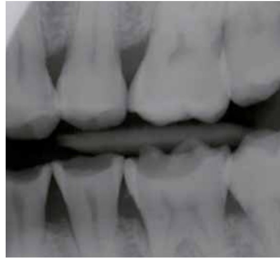
Figuur 1 en 2 Bitewingröntgenfoto voor de behandeling.