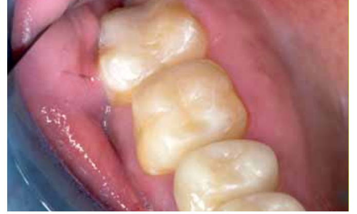
Figuur 9 a Occlusaal aanzicht van enkele elementen in de bovenkaak.