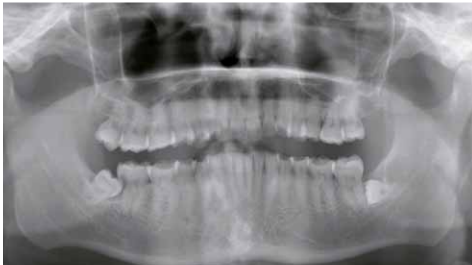
Figuur 3 Orthopantomogram.

een gevolg kan zijn van bepaalde medicatie (SSRI's). 6 Bassoukou et al. vergeleken speekselwaarden (secretiesnelheid, buffercapaciteit en pH) van autistische individuen met die van een controlegroep en vonden weinig verschillen. 7