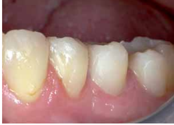
Figuur 8 De elementen 34, 35 en 36.