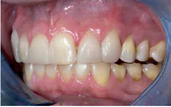
Figuur 7 Elementen voorlopig afgewerkt; goed zichtbaar is de verhoging.