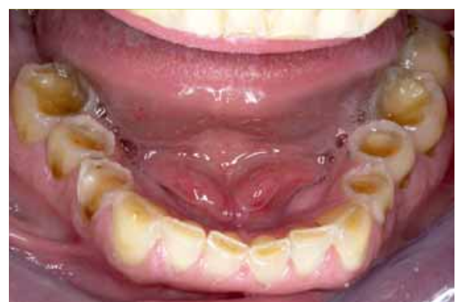
Figuur 4 t/m 6 Mondfoto's van de dentitie voor behandeling.